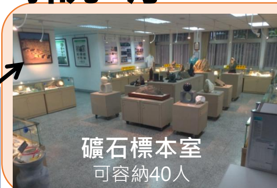
礦石標本室 可容納40人